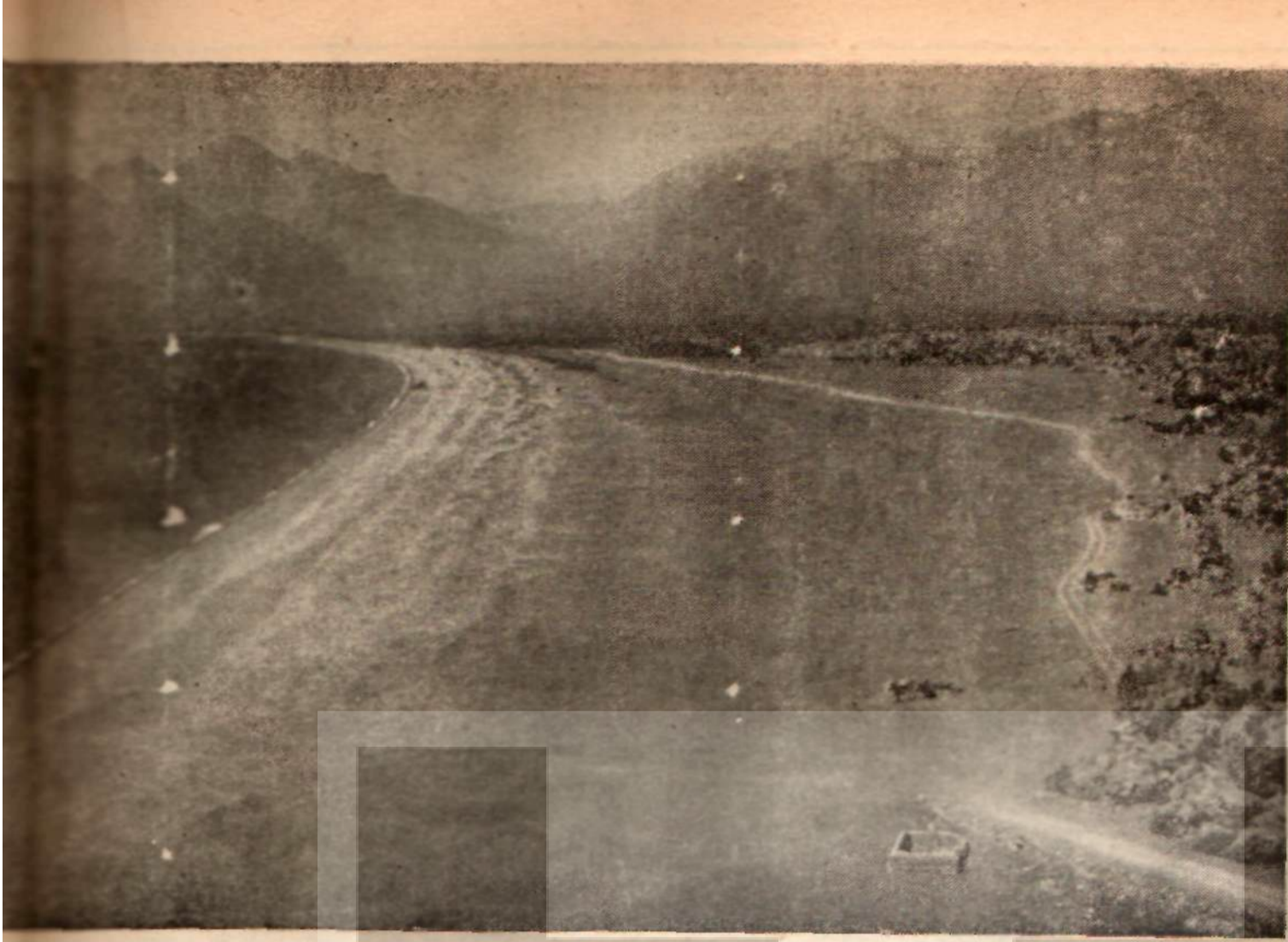
Yabancıların da hırslını çeken cennet sahillerimizden bir kesim

Dr. Halbuki aynı şehirde arsa mülkiyetinin baskıları olmasaydı, devletin yatırdığı büyük malî imkânlarla, dünyaya örnek olabilecek bir modern şehir yaratmak şansına sahipti. Bu arada Ankara'nın planını hazırlayan Prof. Jansen'in, Atatürk'e İmar planını uygulamakla kurtvete sahip olup olmadığını sorduğu sükledir, ve rivayete göre Jansen, arsa spekülasyonlarının baskısını yenmenin harp meydanında zaferler kazanmaktan zor olduğunu ifade etmiştir. Tarih, Prof. Jansen'in tahmini neyd etti.